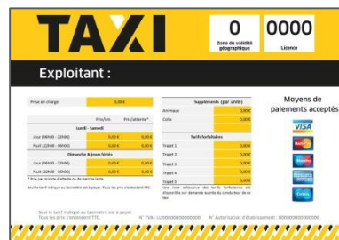
Modèle d'affichage des tarifs