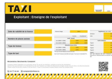
Modèle du tableau taxi