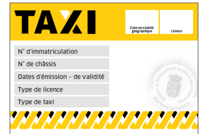
Modèle de plaque-zone-taxi